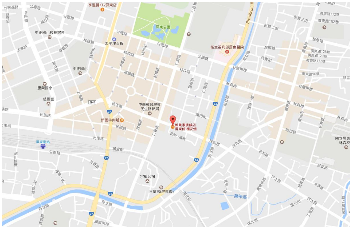
鱈魚家族飯店 屏東館(屏東縣屏東市民生路 255 號 2 樓)